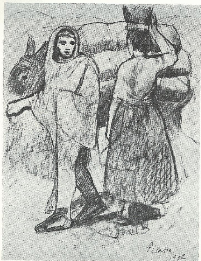
„Campesinos”, tekening van Picasso uit 1902.