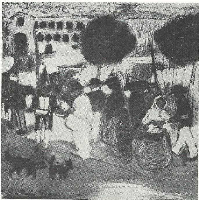
Een pasteltekening van Pablo Picasso uit 1901, „Alrededor de la plaza de toros” (rondom de arena).

Carmen weet José onder haar invloed te brengen. Hoe, blijkt uit de tekst. José laat haar ontsnappen en zal daarvoor straf moeten uitzitten.